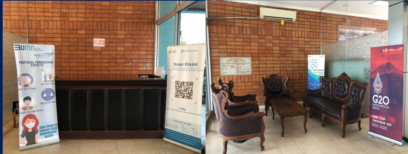
Gambar 1 & 2